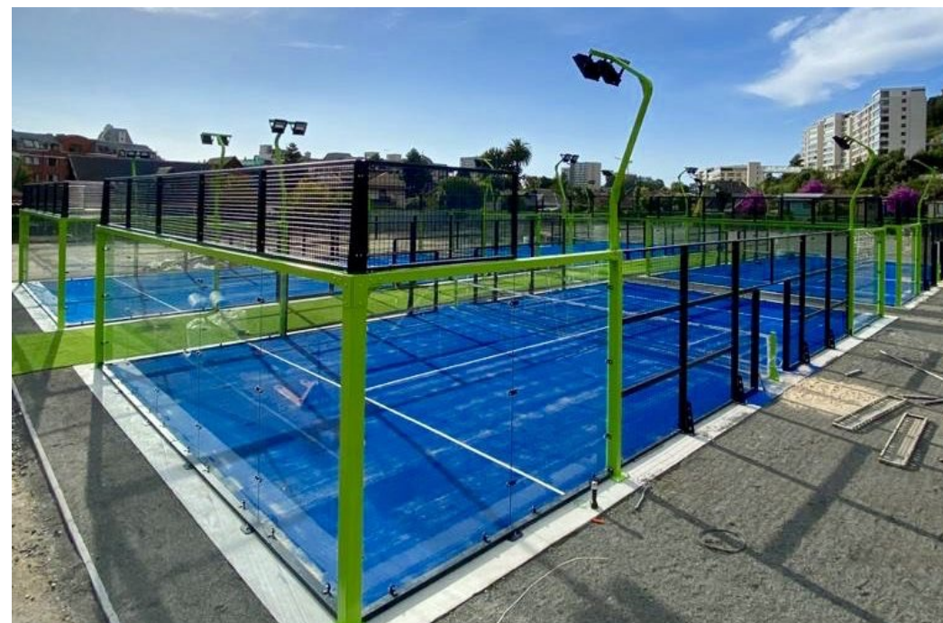
Detalle unidad funcional (4 canchas)

Dimensiones exteriores: 41,5 mts x 23 mts Area: 954,50 mts 2 (* ) Cada cancha tiene iluminación independiente (* ) El color del pasto sintético probablemente sea azul